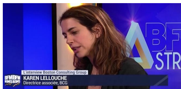
Une émission dédiée, « BFM Stratégie » en live sur BFM TV

ATTENTION PLACES LIMITÉES ! Clôture des inscriptions le 05 mars à 12h00.