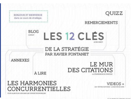
Une application smartphone