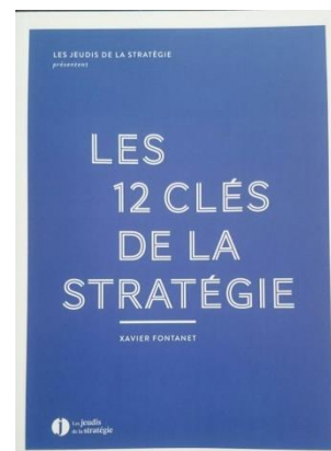
Le livre « Les 12 clés de la stratégie »